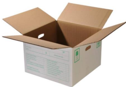
Wäschekarton (50 x 50 x 36 cm) Art.-Nr. 2012 CHF 6.50