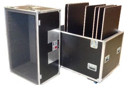
Transportkoffer für Kunst (Masse auf Anfrage) Art.-Nr. 3505 CHF 40.00