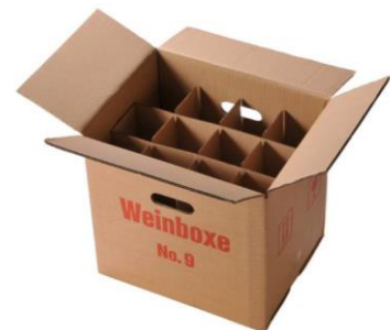
Weinkarton mit Einlagen (für 12 Flaschen) Art.-Nr. 2013 CHF 9.00