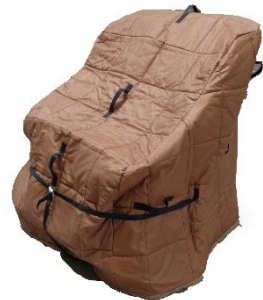
Polsterschutzhülle Stoff 1-Sitzer (100 x 100 x 140 cm) Art.-Nr. 3502 CHF 15.00