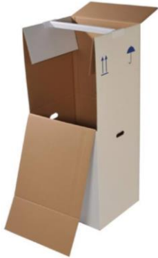
Kleiderbox in Miete (60 x 50 x 137 cm) Art.-Nr. 3501 CHF 12.00

Schutzverpackungen werden am Umzugstag geliefert am gleichen Tag wieder retourniert