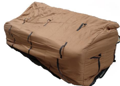
Polsterschutzhülle Stoff 3-Sitzer (200 x 100 x 140cm) Art.-Nr. 3504 CHF 15.00