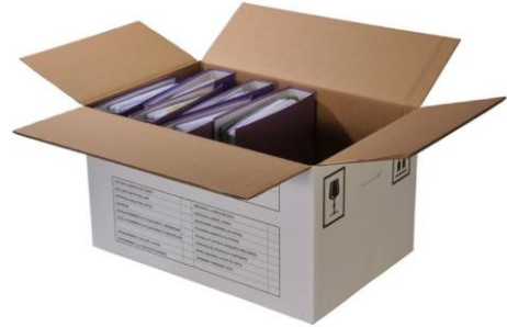
Ordnerkarton (60 x 37 x 35 cm) Art.-Nr. 2009 CHF 6.00