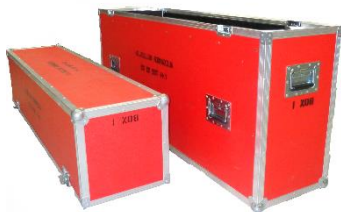
Transportkoffer Flachbildfernseher (19 " bis 50 ") Art.-Nr. 3506 CHF 25.00