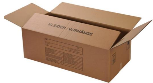
Vorhangkarton (100 x 50 x 36 cm) Art.-Nr. 2011 CHF 13.00