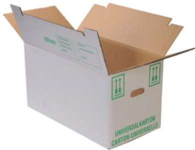
Universalkarton (65 x 35 x 37 cm) Art.-Nr. 2010 CHF 7.00