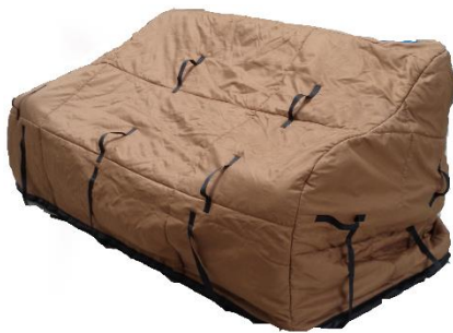
Polsterschutzhülle Stoff 2-Sitzer (170 x 100 x 140cm) Art.-Nr. 3503 CHF 15.00