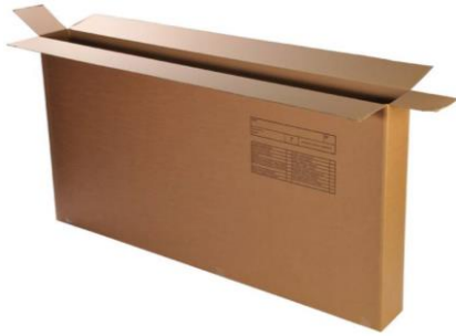
Matratzenkarton (201 x 21 x 105 cm) Art.-Nr. 2008 CHF 23.00

Umzüge Verpackungen Möbellogistik Lagerhaus Containerdepot